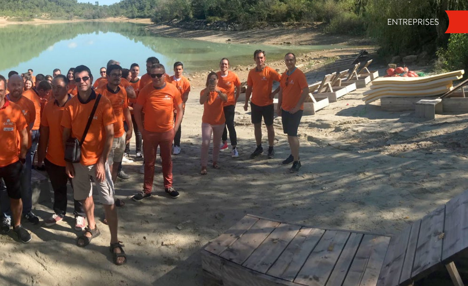
Journée Incentive 2021

région. Cela nous permet d'avoir une connaissance des territoires et des acteurs, tout en garantissant le même niveau d'ingénierie que nos concurrents. Nous sommes par exemple au courant de marchés qui ne font pas l'objet d'appels d'offres », ajoute-t-il. Résultat, des clients (80 % public, 20 % privés, tels qu'Opalia, GGL, Lidl, Angelotti, Vinci Autoroutes ou Eiffage Aménagement) satisfaits sur tous les plans : qualité, continuité, temps accordé. Et un très bon taux de transformation, avec le gain de 30 à 40 % des dossiers déposés, alors que les consultations attirent jusqu'à une vingtaine de réponses.