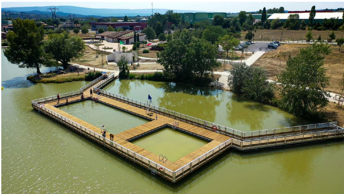
Paysage, Base de loisirs Apt